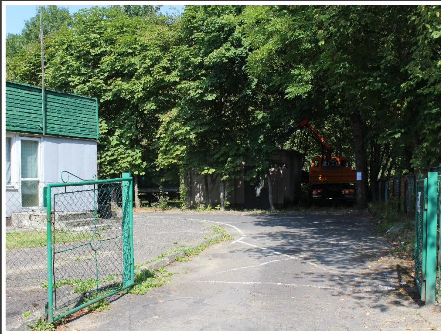
Transformatorownia – północno-wschodni narożnik działki (do pozostawienia)

Przeście z istniejącego Przedszkola Nr 2 (żółty budynek z prawej strony) do terenu inwestycji – dz. nr ewid. 2776